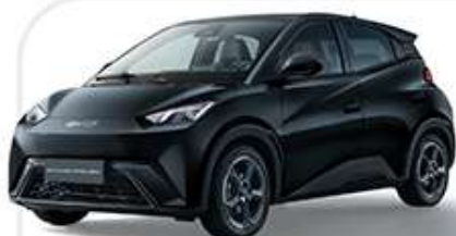
POLAR NIGHT BLACK